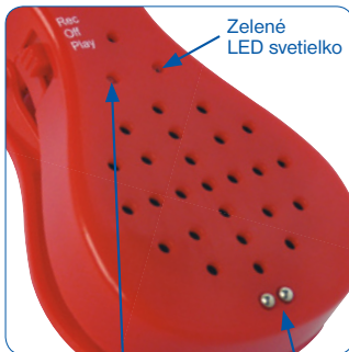
Zelené LED svetielko