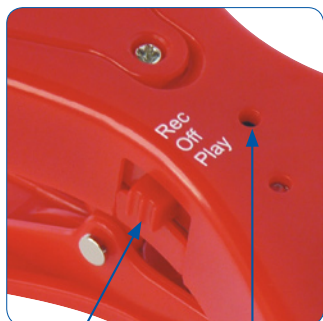
Tlačidlo zapnutia REC/OFF/PLAY